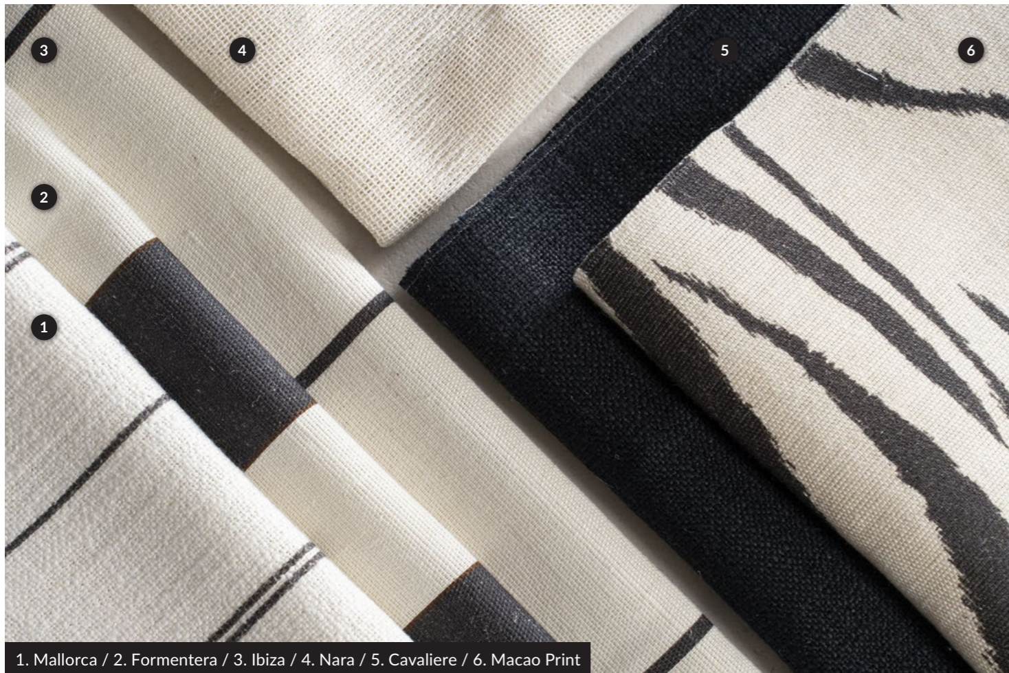
1. Mallorca / 2. Formentera / 3. Ibiza / 4. Nara / 5. Cavaliere / 6. Macao Print

Un tessuto per tendaggi dal forte impatto visivo, realizzato in garza di lino con lavorazione fil coupé. Il motivo astratto prende forma attraverso l'interazione tra la base in garza di lino e un filato più spesso, che conferisce tridimensionalità e profondità al design. Il processo di cimatura crea un elegante contrasto tra leggerezza e struttura. Disponibile in una sofisticata tonalità latte, NARA si distingue per il suo design ricercato e la capacità di arricchire gli ambienti con un gioco di texture unico ed esclusivo.