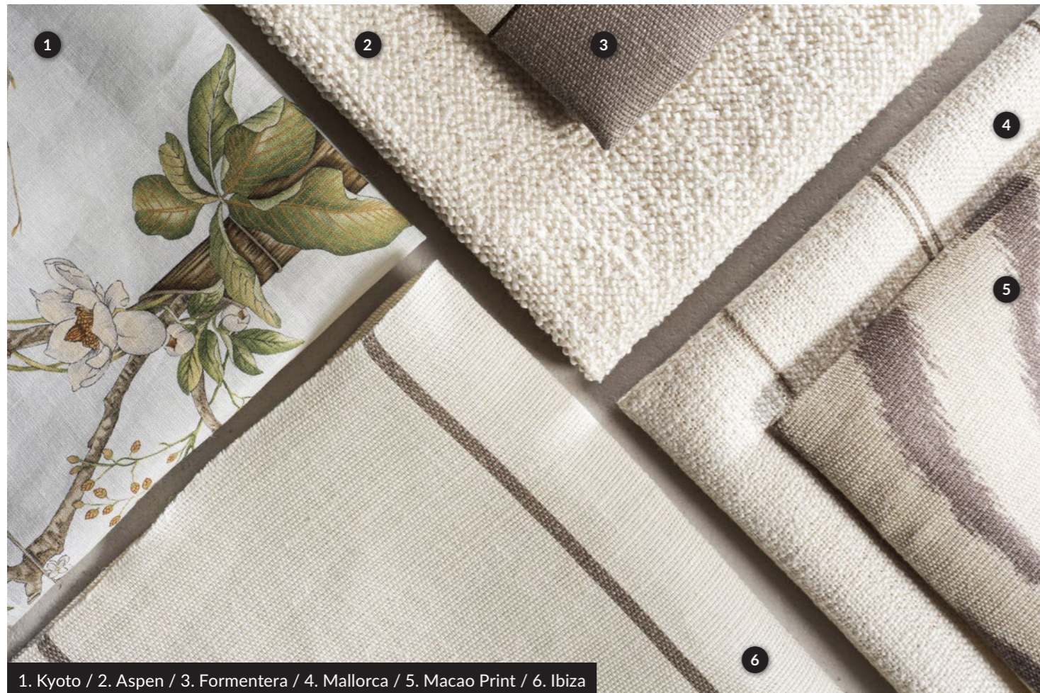
1. Kyoto / 2. Aspen / 3. Formentera / 4. Mallorca / 5. Macao Print / 6. Ibiza

Un tessuto con base in juta e lino che si trasforma in una tela per un audace motivo animalier. Proposto in cinque varianti cromatiche, si abbina perfettamente ai rigati della collezione e alle nuove tonalità del tessuto Cavaliere. Con il suo design unico, dona agli interni un tocco contemporaneo e originale. Perfetto per tende e decorazioni d'arredo.