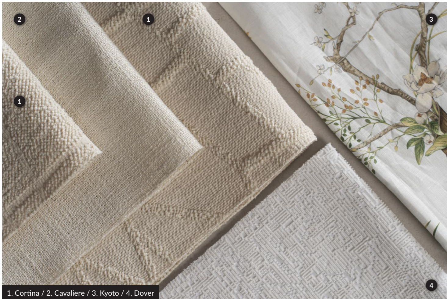
1. Cortina / 2. Cavaliere / 3. Kyoto / 4. Dover

Un tessuto jacquard esclusivo, presentato in una sofisticata tonalità latte. Il motivo geometrico, ispirato alle tracce lasciate dagli sci sulla neve, si distingue per l'armonioso intreccio di linee che creano punti di incontro e dialogo visivo. La struttura double-face ne esalta la versatilità, rendendolo perfetto per rivestire divani con un tocco di eleganza e originalità.