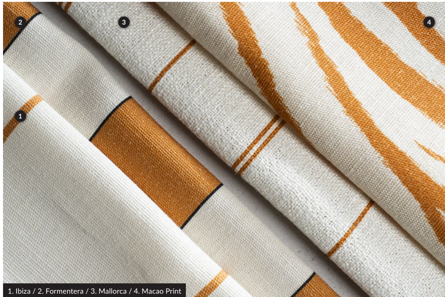
1. Ibiza / 2. Formentera / 3. Mallorca / 4. Macao Print

Un tessuto in lino grosso e armaturato, caratterizzato da una stampa rigata che ricrea l'effetto naturale di un tinto in filo. Disponibile in otto varianti cromatiche, MALLORCA si abbina perfettamente agli altri rigati della collezione e al best seller Cavaliere. La sua consistenza e versatilità lo rendono ideale per donare un tocco di autenticità artigianale agli spazi. Perfetto sia per tende, sia per il rivestimento di divani.